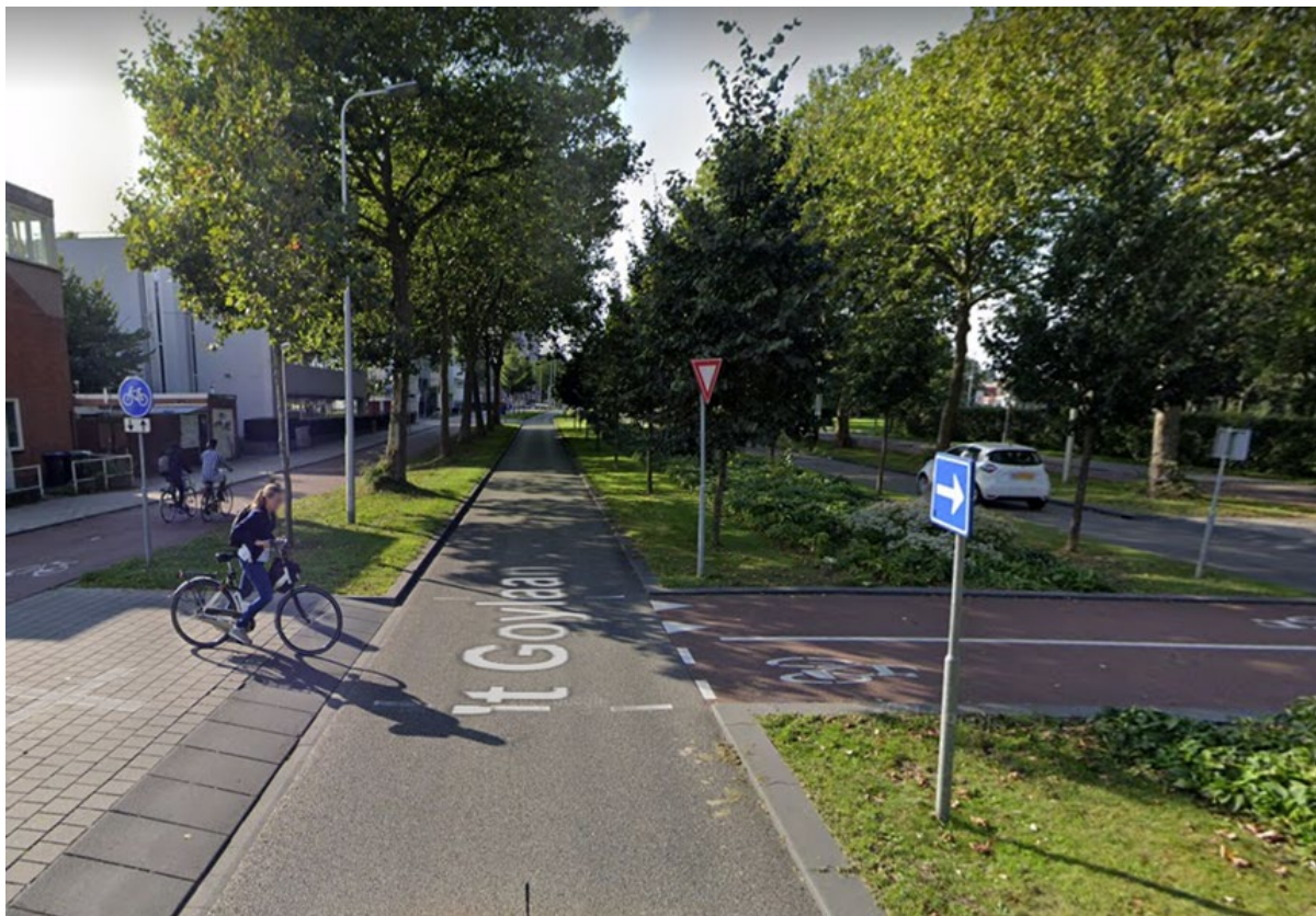
Slika 5: SEDANJE STANJE VPADNICE 'T GOYLAAN V UTRECHTU (L. 2021, VIR GOOGLE MAPS)

Podnebni program mreže Plan B za Slovenijo sofinancirata Eko sklad in Ministrstvo za okolje, podnebje in energijo s sredstvi Sklada za podnebne spremembe. Za mnenja, predstavljena v tem dokumentu, so izključno odgovorni avtorji dokumenta in ne odražajo nujno stališč Ministrstva za okolje, podnebje in energijo ali Eko sklada j.s.