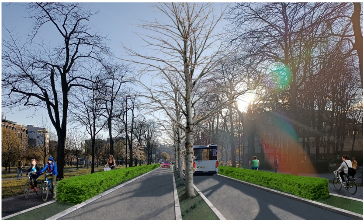
Slika 3: ALTERNATIVNI PREDLOG PREČNEGA PROFILA LINHARTOVE CESTE